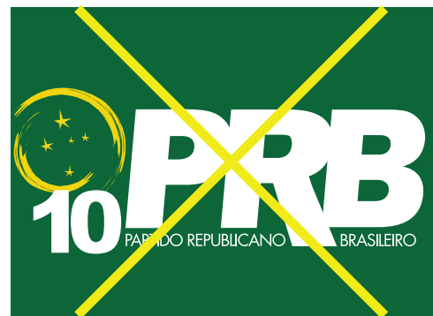
Inverter o lado do símbolo

É expressamente proibida a distorção da logomarca PRB contrariando as proporções estabelecidas, além das alterações das cores institucionais e suas posições.