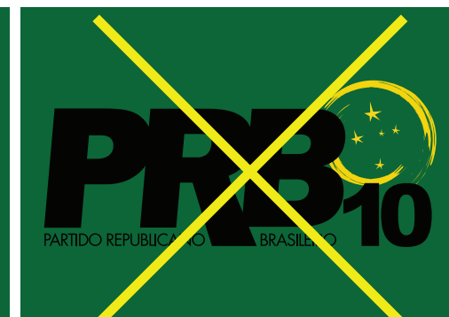
Nome na cor preta