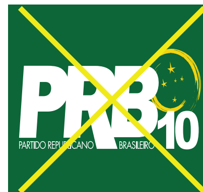
Distorção por condensação