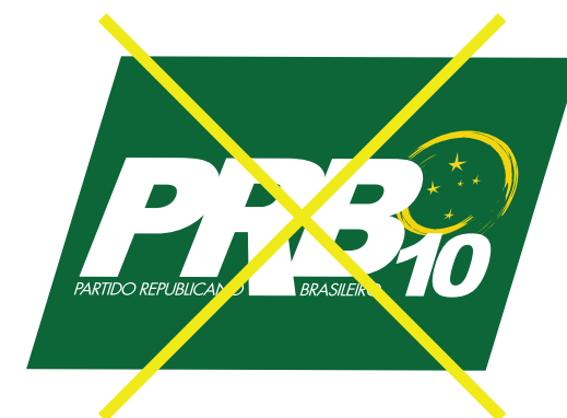
Distorção por inclinação